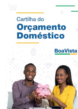
Cartilha do Orçamento Doméstico