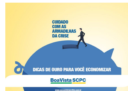
Guia Dicas de Ouro para você Economizar